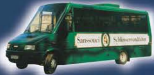
Potsdam Bus „Großer Kurfürst“ (max Kap.: 28 Personen)