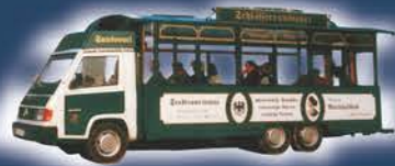
Potsdam Mobil „Alter Fritz“ (max. Kap.: 22 Personen)

Durch die Stadt und zu den Schlössern (Busse auch für Gruppen zu mieten)