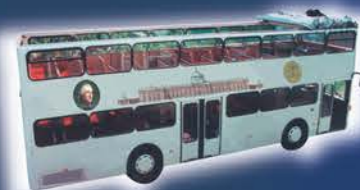
Cabriolet-Doppeldecker (max Kap.: ca. 80 Personen)