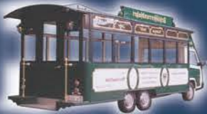
Potsdam Mobil „Königin Luise“ (max Kap.: 24 Personen)