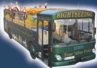
Cabriolet-Eindecker „Butt“ & „Dicker Wilhelm“ (max Kap.: je 42 Personen)